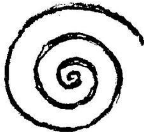
Fig. 1 is a clock spring wound up tight, to exemplify concentration.