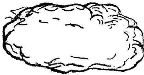
Fig. 3 & 4 represents water concentrated into a drop and de-centrated into vapor.